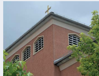
Matthäuskirche Vorholzstraße 47