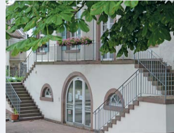
Paul-Gerhardt-Kirche Breite Straße 49 a